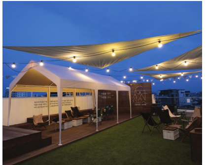
▲ 캠핑체험카페 전경